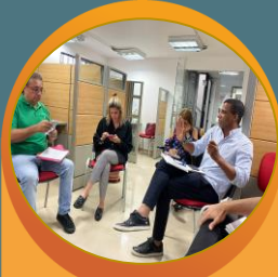
Sentimiento de pertenencia al proceso